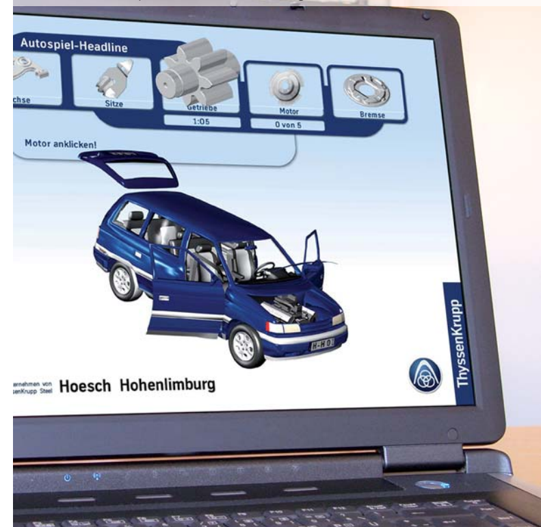
Interaktives Messenspiel für Hoesch Hohenlimburg

Je früher man die 3D-Animation für die Kommunikation nutzt, desto eher kann man von deren Vorteilen profitieren und sich einen Erfahrungsvorsprung gegenüber der Konkurrenz erarbeiten.