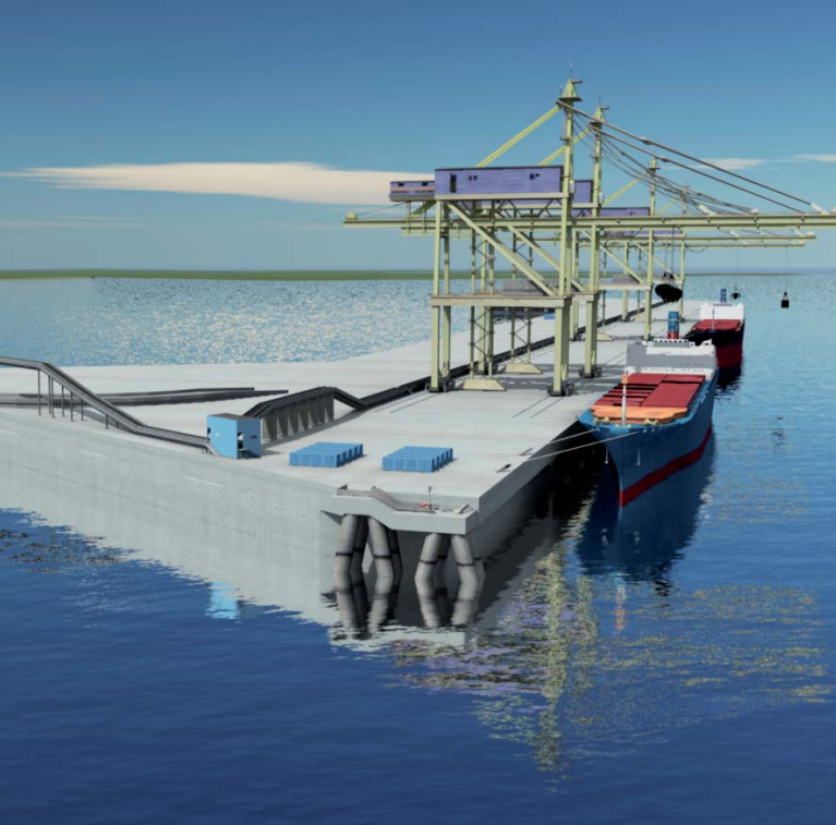
3D-Film zum entstehenden Hüttenwerk von ThyssenKrupp Steel in Brasilien, Hafenanlage

Animation fasst Ideen in Bilder und lässt sie so greifbar werden.